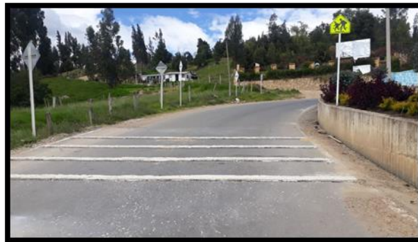
Señalización vertical y horizontal Cuitiva