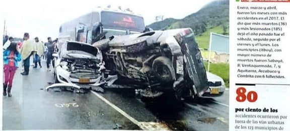
Por escasez de velocidad el año pasado se registraron 18 muertos y 61 lesionados y por exceso al volante 12 muertos y 47 heridos.