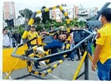
El plan de la Seguridad Vial es directo en el país y hace parte de la estrategia con la que el Itboy está tratando de salvar vidas en las vías.

cional el que tiene adelantado el tema, sino que también alcaldes, concesionarios y empresas de transporte se juegan los de las gasas. Pero el Gerente del Itboy no es de los que solo pide y espera a que "pasa gobierno le dé, para este año por ejemplo se la juega para bajar la accidentalidad utilizando una estrategia que abarca diferentes frentes. Por ejemplo se fortalecerá la campaña de "Por vía segura" y se complementará