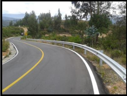
Defensa metalica vía Floresta