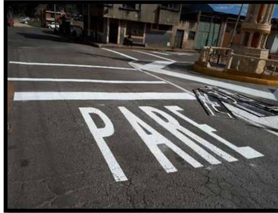
Proceso de instalación de marcas viales