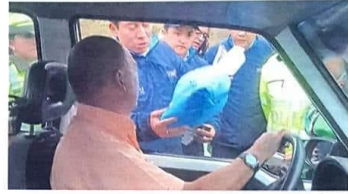
El Instituto de Boyacá se ha puesto la chapa de Itboy, para salvar vidas en las vías, con sus campañas.