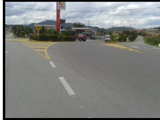
Marcas viales ingreso Santa Rosa Viterbo