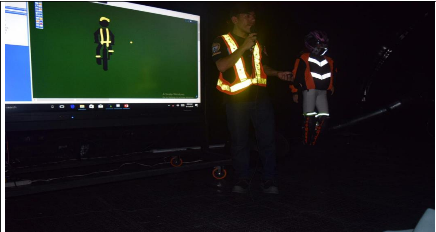
Operativos de control y pedagógicos