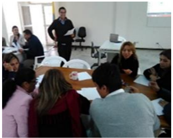
Sistema de gestión y seguridad en el trabajo